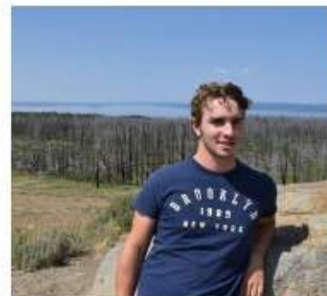
Warre Vyncke Zeeverkenners