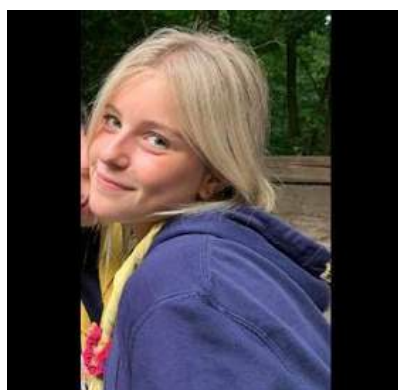
Haike Vandervorst Zeehondjes