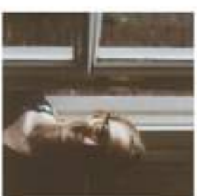
Tine Wvntjn Takleiding Zeeverkenners