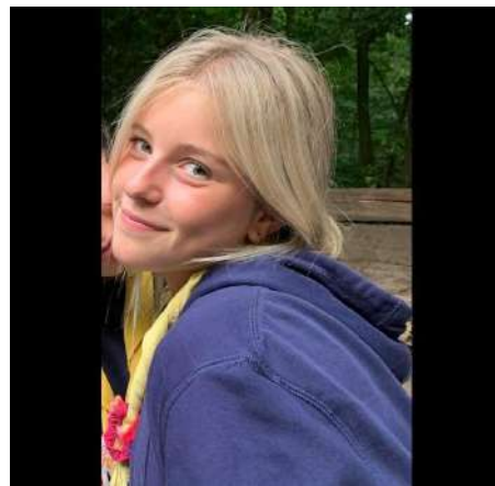
Haike Vandervorst Zeehondjes