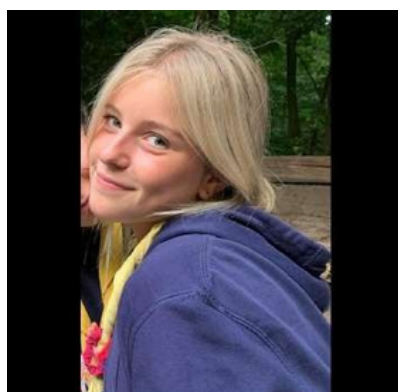
Haike Vandervorst Zeehondjes